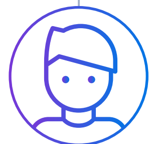
BJÖRN DE KLANT